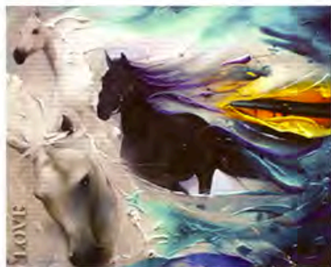
EL LIBRO DE LA VIDA ABRIEL ALAN, EL GRAN SEÑOR DE PUNTA GORDA